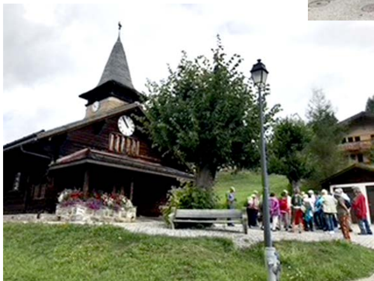
Visite à l'église