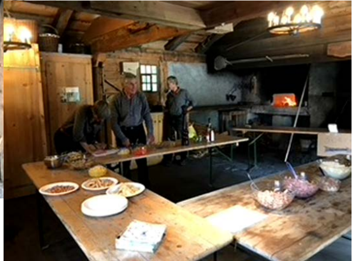
Au boulot !