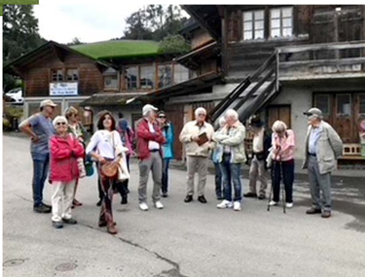
Apcadiens prêts au départ