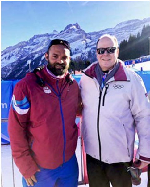
Simon Rouèche et le prince Albert de Monaco

Les dernières semaines avant les JOJ 2020 ont été bien remplies, tout le monde commence à réaliser l'importance de cet événement et veut qu'il soit une réussite. Il se profile alors de séances et des discussions tardives afin que tout le monde vive cette fête de la meilleure manière qui soit.