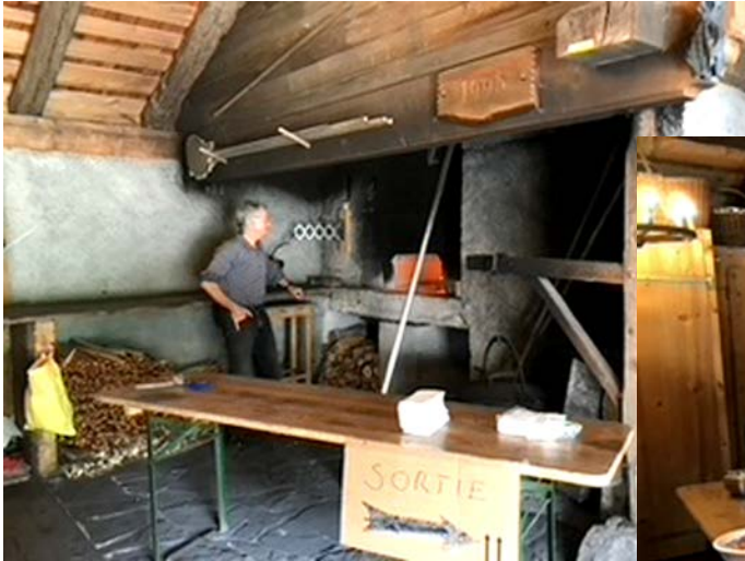
Four à pizza