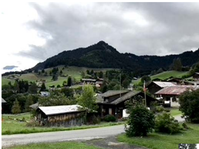
La Forclaz, village authentique

«On monte une meule à foin à La Forclaz sous le regard surpris et émerveillé des membres de l'Association des propriétaires de chalets et d'appartements des Diablerets et d'Ormont-Dessus (APCADO), en visite au village le même jour..»(Extrait de l'édito de Elisabeth Bühlmann – Le Cotterg, septembre 2020)